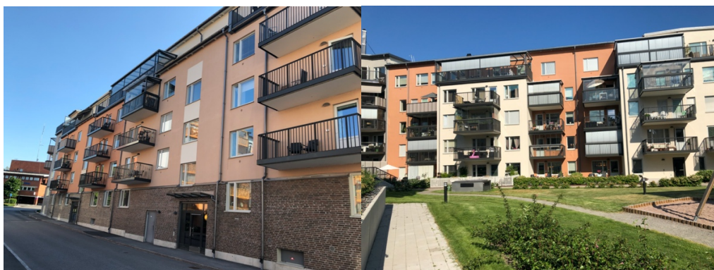
Fasad mot Trädgårdsgatan

Fastigheten byggdes 2015 – 2017 och övertogs av föreningen från byggherren, Credentia, den 30 juni 2017